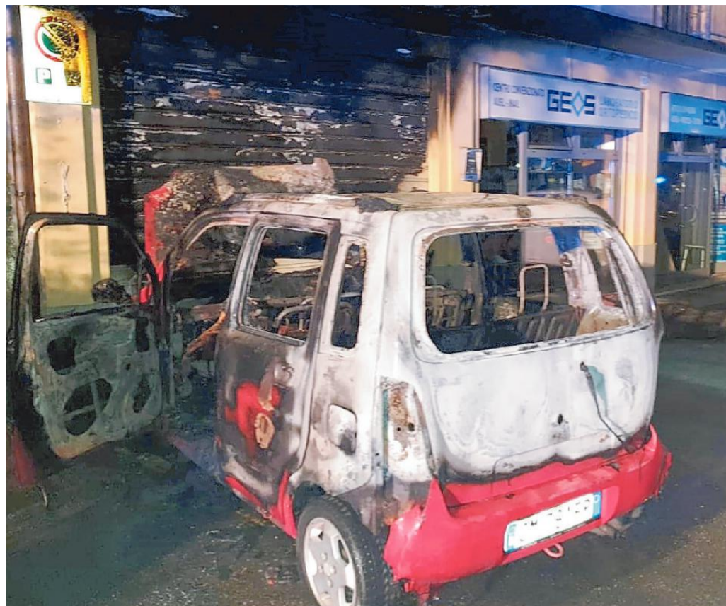
Così si presentava la macchina al termine del lavoro di spegnimento dell'incendio

Inoltre sarebbe auspicabile un lavoro di indagine per individuare e rendere innocue queste bande.