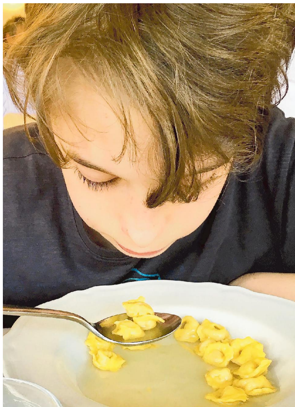
I tortellini in brodo di cappone: un "evergreen" della cucina modenese

La serata di stasera, nel rispetto dei protocolli anti contagio, prevede la misurazione della temperatura e l'uso delle mascherine. A tutti gli ospiti che si sono prenotati arriverà una mail con l'assegnazione del posto ai Giardini Ducale. Basta mostrarla al desk d'ingresso.