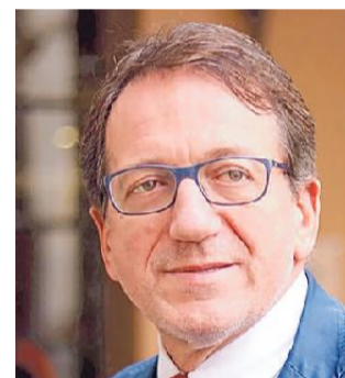
GIANCARLO MUZZARELLI SINDACO DI MODENA. È STATO RIELETO AL PRIMO TURNO NEL 2019

Modena può vantare produzioni agroalimentari di assoluta eccellenza e un settore economico di filiera capace di innovazione all'insegna della qualità, che è l'elemento che ci distingue nella com-